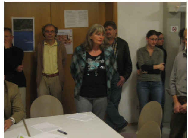
1. Ortskern u. Ortsdurchfahrt