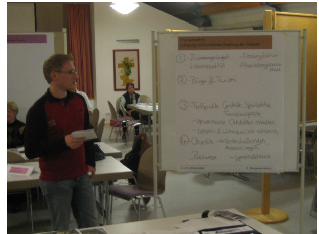
4. Komm. Energiekonzept